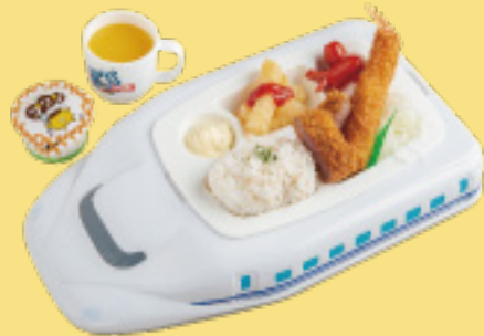
おこさまプレート