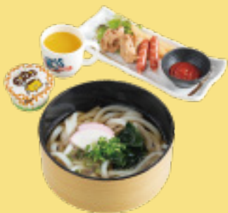
おこさまうどんセット