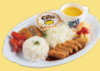
おこさま牛カツセット