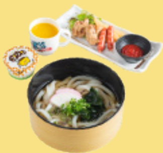
おこさまうどんセット