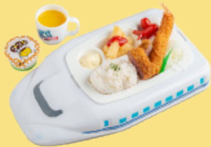
おこさまプレート