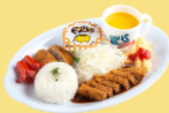
おこさま牛カツセット